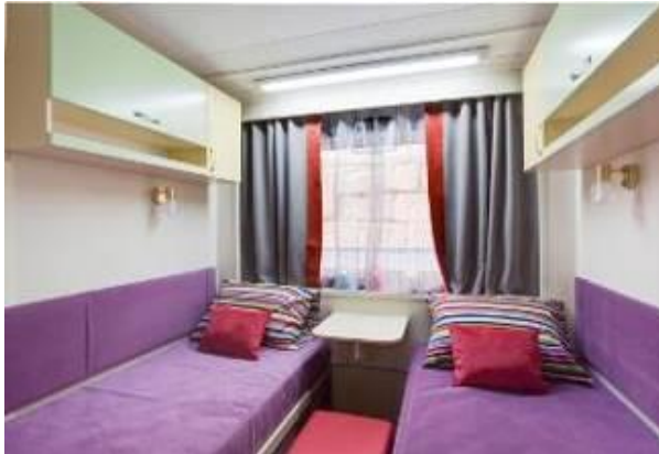
Cabine standard B2 et B1

Réparties sur trois ponts, les cabines ont fait l'objet d'un lifting complet. Elles ont été agrandies et sont au nombre de 102 : Des Suites Deluxe de 18 m 2 et des cabines de 8,5 m 2 et de 9 m 2 . Entièrement redécorées, équipées de deux lits bas, d'une TV écran plat et d'un coffre-fort, elles offrent tout l'espace et le confort que l'on peut attendre d'un bateau de croisières fluviales. Toutes extérieures, elles possèdent de larges fenêtres. Les salles de bain, reconstruites avec des matériaux clairs et lumineux, sont pourvues d'une douche, d'un lavabo, d'un WC et disposent d'un sèche-cheveux.