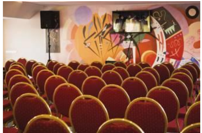
Salle de conférences