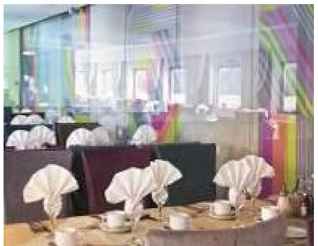
Restaurant M/S Kandinsky Prestige